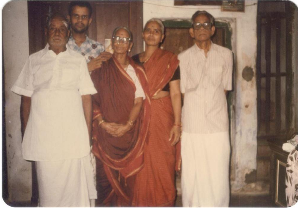
தாத்தா-பாட்டி, ரவி, அம்மா-அப்பா

பாட்டி பேசுவதில் எப்போதும் பழமொழிகளும் சொற்றொடர்களும் (idioms and phrases) நிறைந்திருக்கும். தங்கள் குல தெய்வமான வெங்கடரமண ஸ்வாமியிடம், 'மலை போல வந்த கஷ்டத்தையெல்லாம் பனி போல நீக்கி வை ஏழுமலையானே' என வேண்டிக்கொள்வார். குழந்தைகளைக் கொஞ்சிவிட்டு, 'கோடி துக்கம் ஒரு குழந்தை முகத்தில் மறையும்' என்பார். மகிழ்ச்சியான செய்தியைக் கேட்டால், 'சந்தோஷம் சகல பலம்' என மகிழ்வார். கடினமான செய்தியைச் கேட்டால், 'சாண் ஏறினால் முழம் சறுக்குகிறது' என வருத்தப்படுவார். அஞ்ச வேண்டியதற்கு அஞ்சாமல் யாராவது சுலபமாக வளையவந்து கொண்டிருந்தால் 'எட்டு அரப்பையும் போட்டு அலம்பி வைத்திருக்கிறது' என்றோ அல்லது 'ஒக்க சிரிச்சா வெக்கமில்லை' என்றோ இடித்துக் காட்டுவார். 'தங்க ஊசி என்றால் கண்ணில் குத்திக் கொள்ளமுடியுமா?', 'பித்தளையை பலக்க தட்டாதே', 'தன்