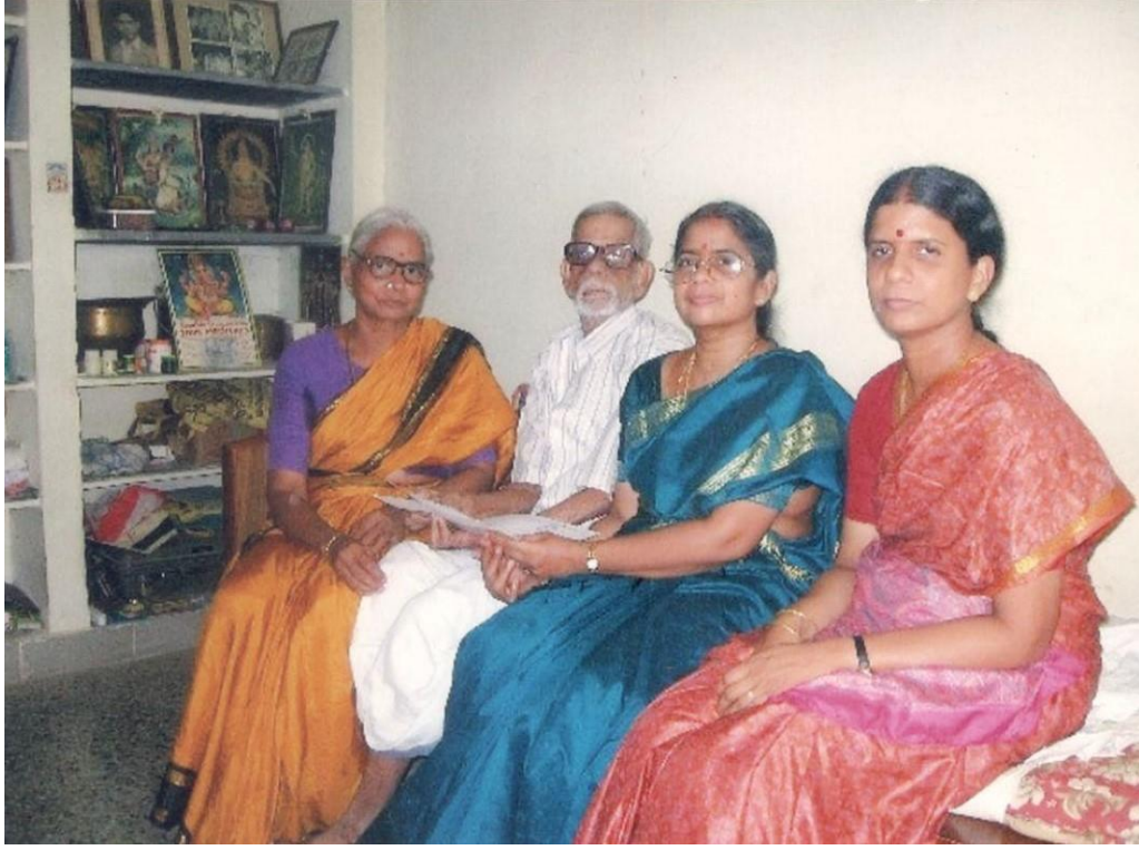
2006 : அம்மா-அப்பா இரு மகள்களுடன்

2007ஆம் வருடத்தின் ஜூன் மாதத்தில் நான் அவர்களை உதவிக்கு வந்து இருக்குமாறு கேட்டுக்கொண்ட போது ஒரு வாரம் வந்து தங்கி உதவியாக இருந்தார்கள்.