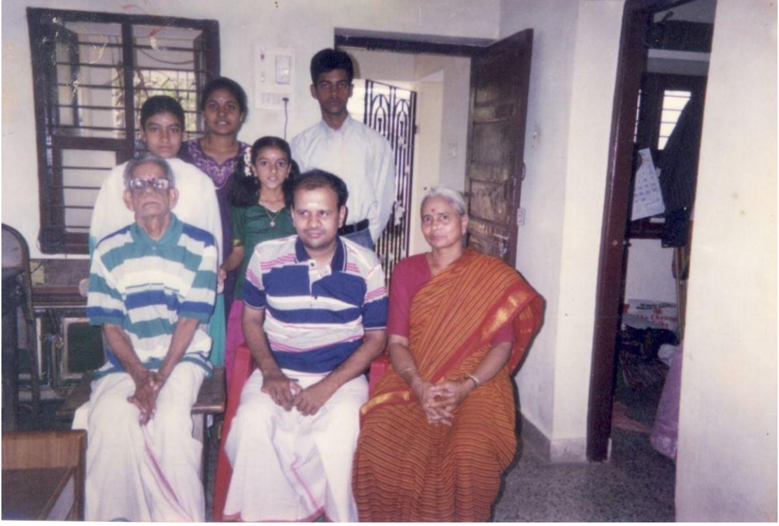
February 2002 : அப்பாவின் எண்பதாவது பிறந்த நாளன்று

பூஞ்சையான உடல்வாகு கொண்ட அப்பாவிற்ரு நாளடைவில் தெம்பு குறைந்து வந்ததால் அவருக்கே அம்மாவின் உதவி தேவைப்பட்டது. வீட்டு வேலை மட்டும் வெளி வேலைகளோடு ரவியையும் முழுநேரமும் பார்த்துக்கொள்வது அம்மாவின் பொறுப்பானது. அப்பாவுக்கும் அம்மாவுக்கும் பதினைந்து வயது வித்தியாசமானதால் அம்மாவுக்கு அப்போது அறுபத்தி ஐந்து வயதுதான் என்றாலும் அவருக்கு இருந்த வேலைகளின் பளு அந்த வயதுக்கு மீறியதாக இருந்தது. அம்மா மனோதாரியத்துடன் எல்லாவற்றையும் சமாளித்தாலும் அவரது உடல்நிலை அவ்வப்போது கடுமையாகப் பாதிக்கப்பட்டது.