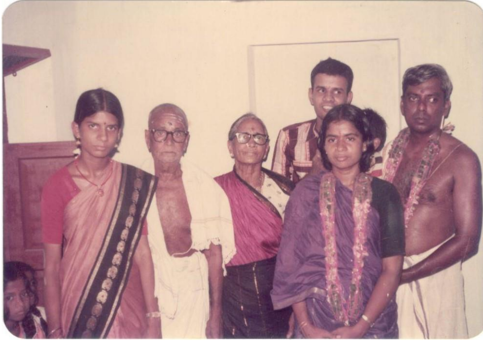
கிருஹப்பிரவேச தினத்தன்று தாத்தா-பாட்டியுடன்

பிறகு அந்த வீட்டிற்கு வாடகைக்கு ஆள் பார்த்து வைக்கும் பொறுப்பை அம்மாவும் வரவு-செலவுக் கணக்கைப் பராமரித்து வங்கியில் வாடகையைக் கட்டும் பொறுப்பைத் தாத்தாவும் எடுத்துக்கொண்டனர். தாத்தா-பாட்டி என் மீது வைத்திருந்த நம்பிக்கையை வீணாக்காமல் காசைக் கருத்தாகச் சேமித்து நான் தர வேண்டிய மீதிப் பணத்தை மூன்று வருடங்களில் கொடுத்து முடித்தேன்.