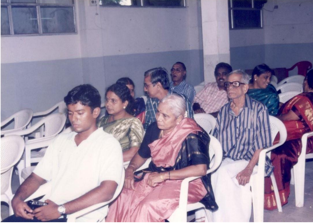
:பிப்ரவரி 2004 : அம்மா-அப்பா

அப்பா-அம்மா தங்களது முதல் மூன்று பேத்திகளின் திருமண நிச்சயதார்த்தங்களிலும் திருமணங்களிலும் தம்பதியாகப் பங்குகொண்டு மகிழ்ந்திருக்கிறார்கள்.