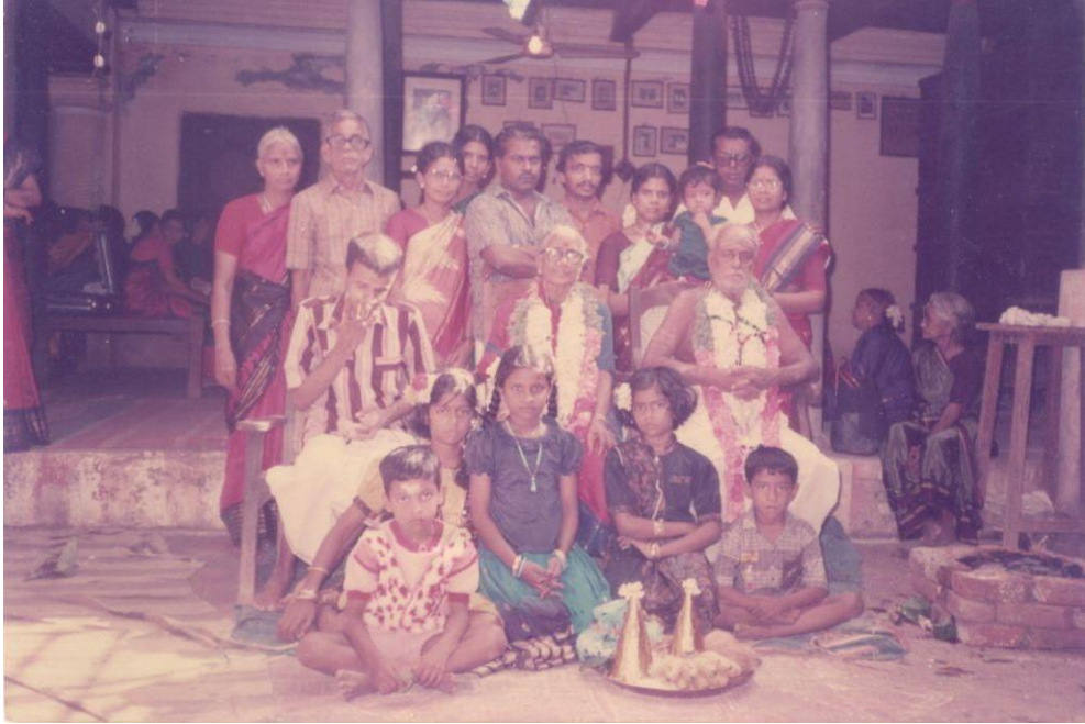
தாத்தா-பாட்டியின் சதாபிஷேக தினத்தன்று

1990ஆம் வருடத்தின் ஜூன் மாதத்தில் தாத்தா-பாட்டியின் சதாபிஷேக விழாவைச் சிறிய அளவில், நெருங்கிய உறவினர்கள் சூழ, எளிமையாகக் கொண்டாடி மகிழ்ந்தோம். விழா மடத்துத் தெருவிலிருந்த தாத்தாவின் முதலாளி வீட்டில் நடந்தது.